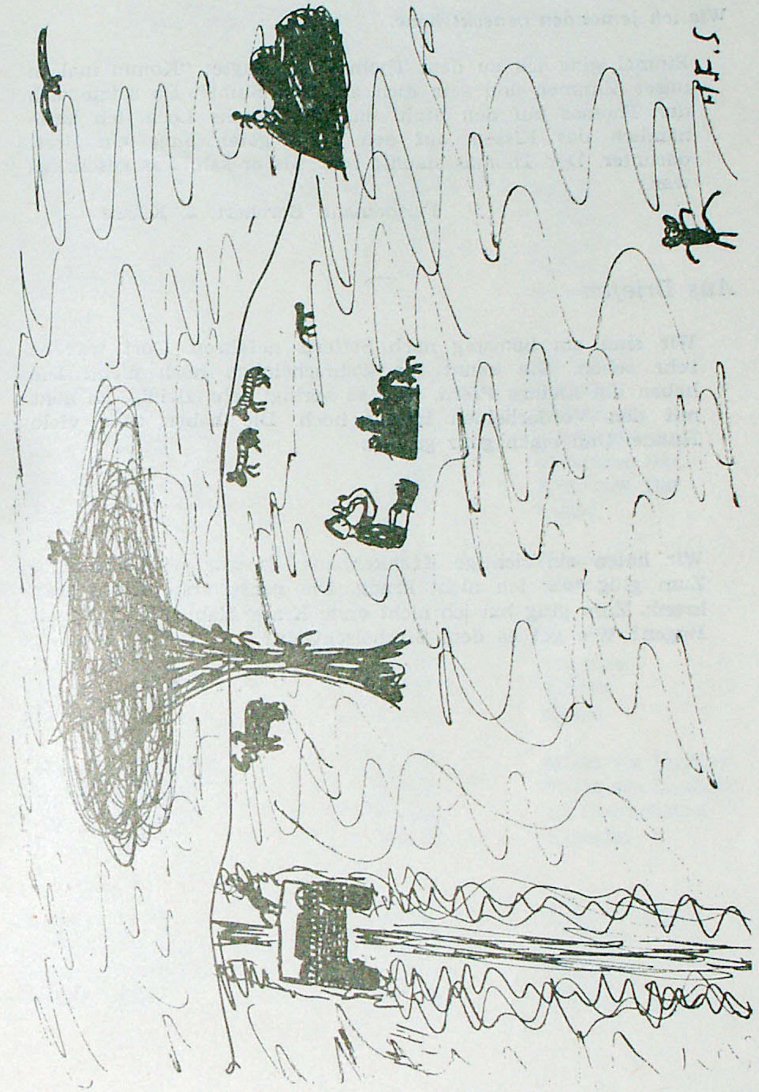
Ein Picknick in der Wildnis