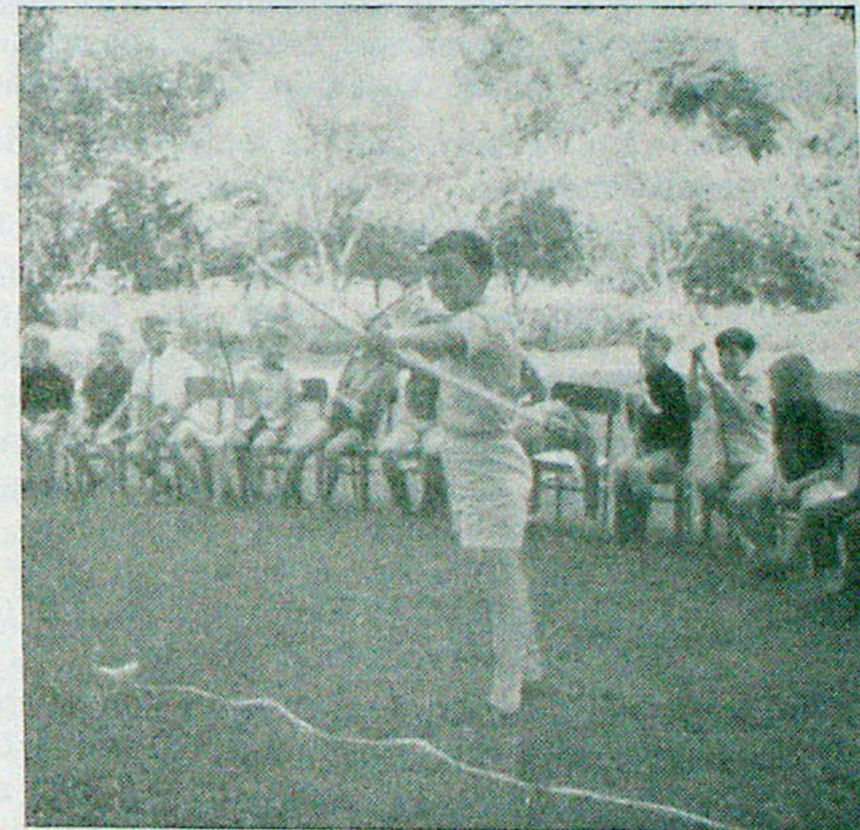
Kindergeburtstag im Garten