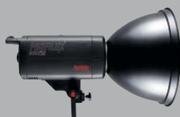
LUXSTU 2* Blitzgerät, 250 Ws